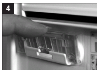
4 Navneskiltholderen trykkes igen på plads.