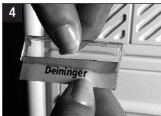
4 Det nye navneskilt lægges i holderen.