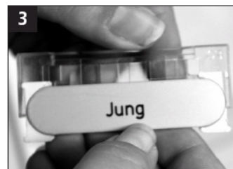
3 Det nye navneskilt lægges i holderen.