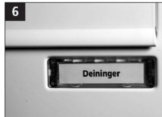
6 Det nyindsatte navneskilt.