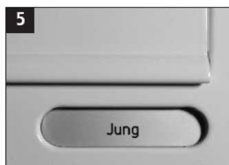
5 Det nyindsatte navneskilt.