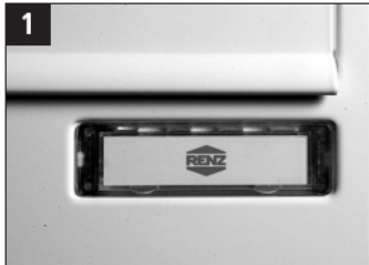
1 Det gamle navneskilt.