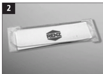
2 Ved graveringsnavneskilte fjernes navneskiltglasset.