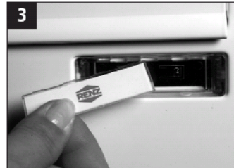
3 Navneskiltet udtages.