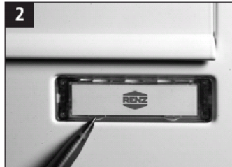
2 Navneskiltet tages ud ved at trykke i begge indhak. Undgå at bruge metalredskaber.