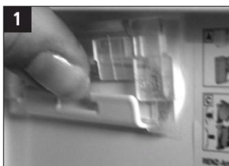
1 Navneskiltholderen tages ud ved at trykke på midten af holderen og presse opad.